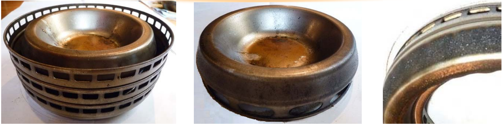
(※汚れは稼働条件、また稼働状況により異なります。)