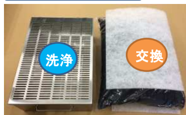
活性炭カートリッジ×2

脱臭効果が薄れてきたら活性炭を新品と交換してください。 (目安6~12ヶ月。稼働状況により前後あり) 合わせてプレフィルタ大(上下2枚ずつ)を新品に交換してください。 活性炭交換時はカートリッジを洗浄してください。