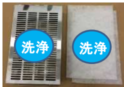
サブBOXプレフィルタ

中性洗剤でつけ置き後、水洗いしてください。 完全に乾燥させてから使用してください。