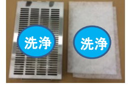
サブBOXプレフィルター

中性洗剤でつけ置き後、水洗いしてください。 完全に乾燥させてから使用してください。