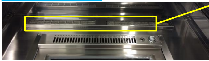
吸込口用ニッケルフィルター