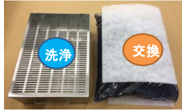
活性炭カートリッジ×2

脱臭効果が薄れてきたら活性炭を新品と交換してください。 (目安6~12ヶ月。稼働状況により前後あり。) 合わせてプレフィルター大(上下2枚ずつ)を新品に交換してください。 活性炭交換時はカートリッジを洗浄してください。