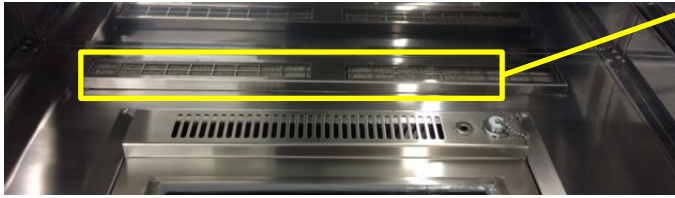
吸込口用ニッケルフィルター