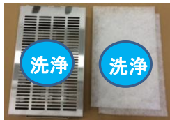
サブBOXプレフィルター

中性洗剤でつけ置き後、水洗いしてください。 完全に乾燥させてから使用してください。