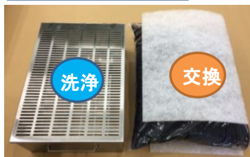
活性炭カートリッジ×2

脱臭効果が薄れてきたら活性炭を新品と交換してください。 (目安6~12ヶ月。稼働状況により前後あり) 合わせてプレフィルター大(上下2枚ずつ)を新品に交換してください。 活性炭交換時はカートリッジを洗浄してください。